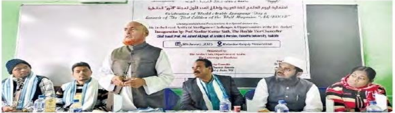
বর্ধমান বিশ্ববিদ্যালয়ে সেমিনারে উপস্থিত রয়েছেন বিশিষ্ট অধ্যাপকরা

উপস্থিত বিশিষ্টদের বক্তব্য, সারা বিশ্বে আরবি ভাষার ধর্মীয় গুরুত্ব যেমন রয়েছে তেমনই রাজনৈতিক, অর্থনৈতিক, সাংস্কৃতিক প্রত্যেকটা দিক থেকে এই ভাষা খুবই গুরুত্বপূর্ণ। ব্যবহারের দিক থেকে বর্তমান বিশ্বের চতুর্থতম ভাষা হল আরবি। এ জন্যই প্রায় চার দশক আগে ১৯৭৩ সালের জাতিসংঘের সাধারণ সভার ২৮তম অধিবেশনে আরবি ভাষাকে এর